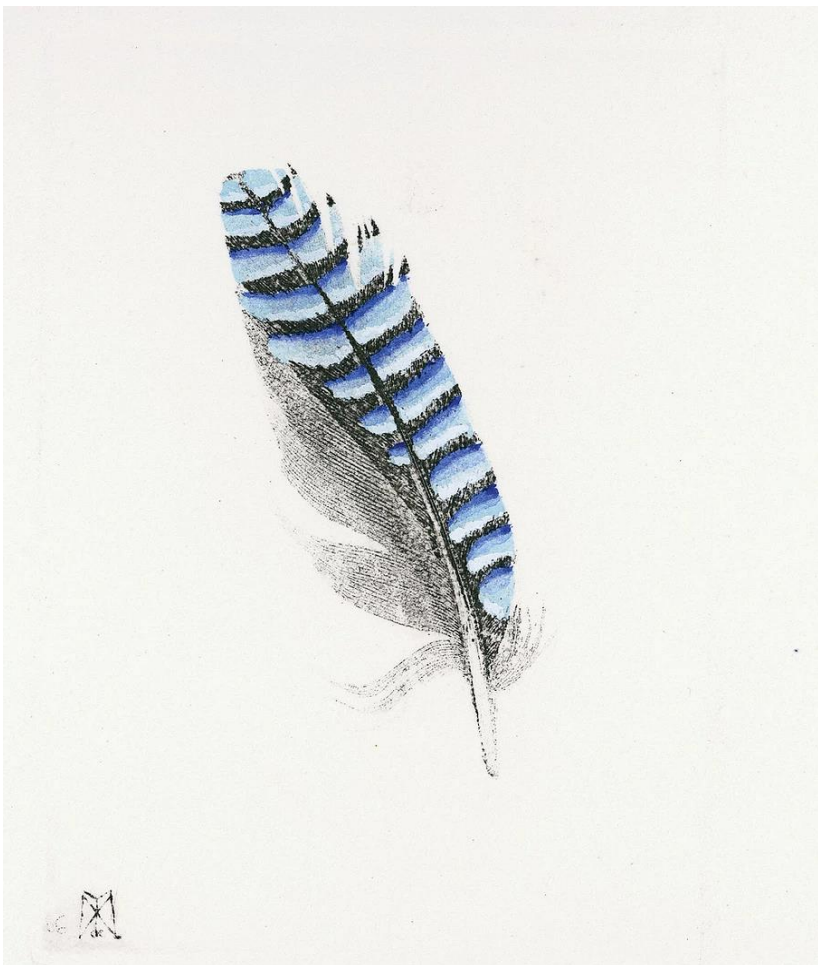
Xavier de Maistre Penna di ghiandaia 1996