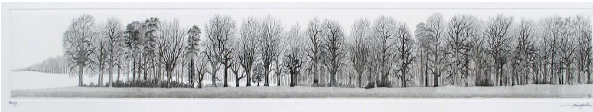
Xavier de Maistre Il bosco 2011