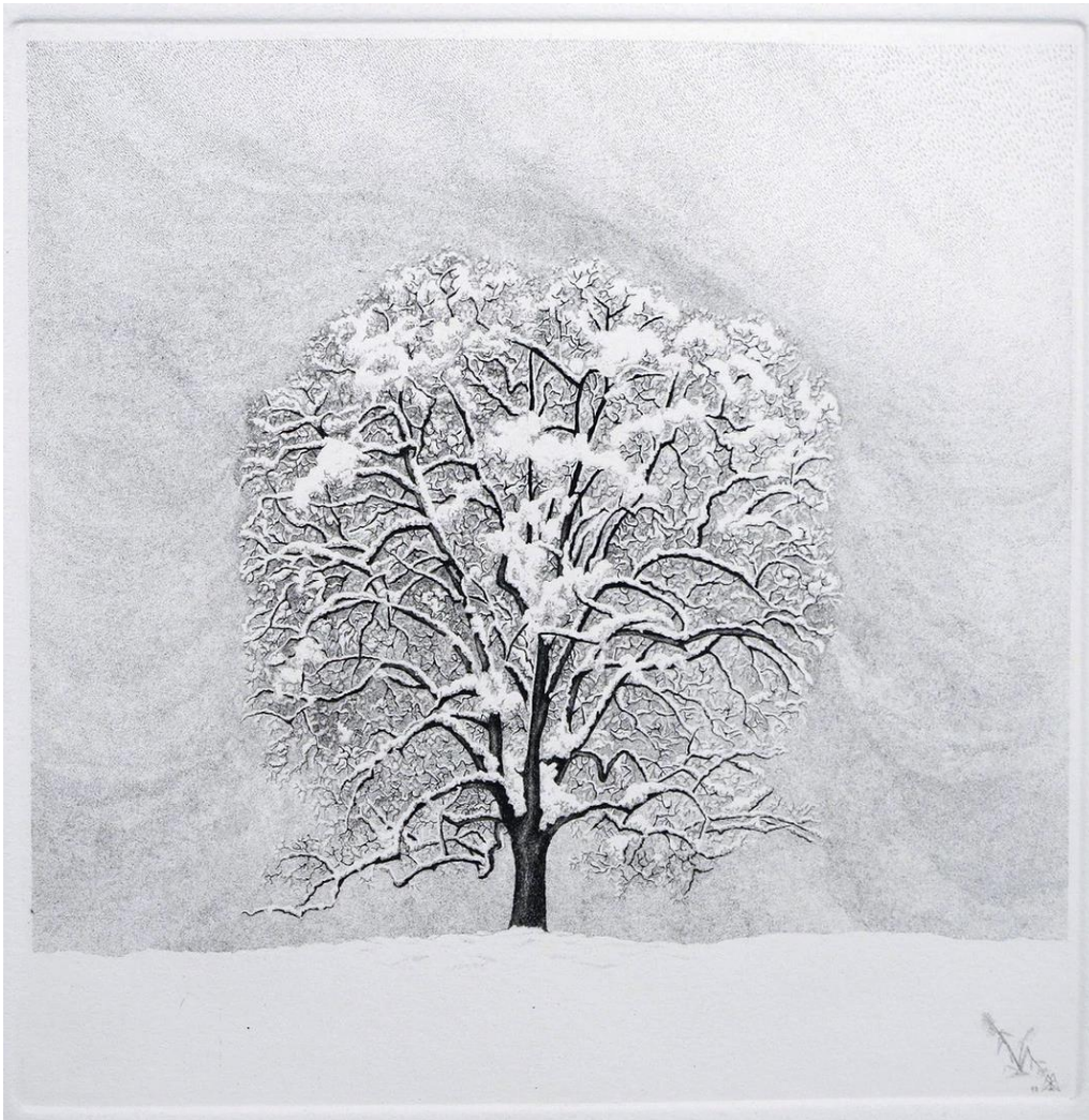
Xavier de Maistre Magnolia con neve 2012

«Io credo che la grande scienza e la grande arte incrinino le aspettative consuete e indichino nuovi modi di vedere il mondo, ricchi e significativi. E non solo cambiano il modo di vedere il mondo ma cambiano anche il nostro modo di stare al mondo» Giulio Giorello